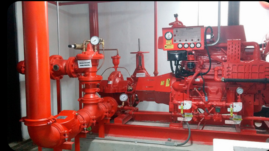
SISTEMAS CONTRA INCENDIOS