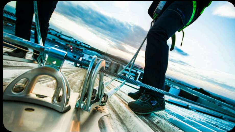
TRABAJOS DE DIFICIL ACCESO