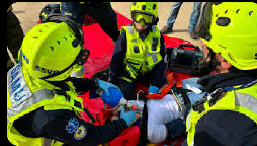
SEGURIDAD Y EMERGENCIAS