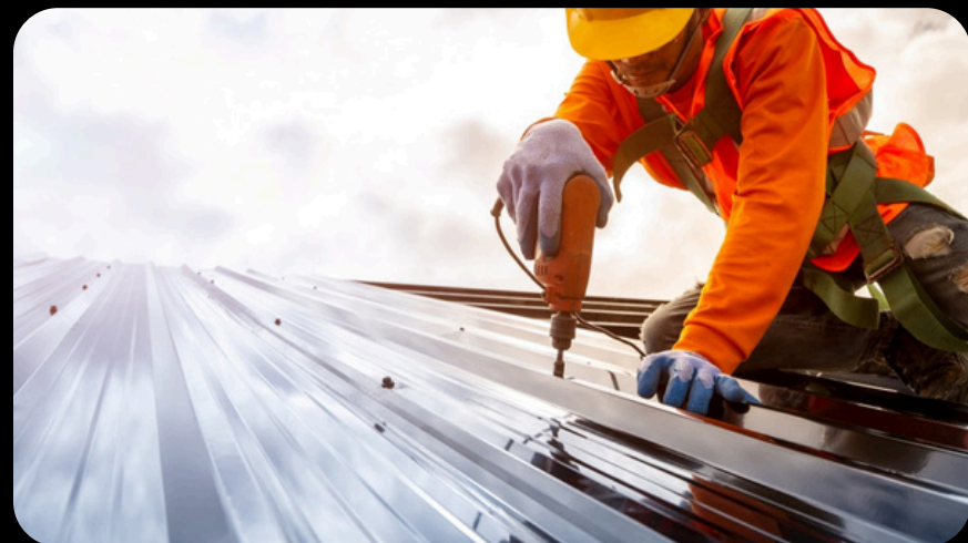
OBRAS MENORES /LIMPIEZA INDUSTRIAL